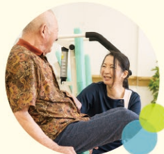
リハビリ(機能訓練)